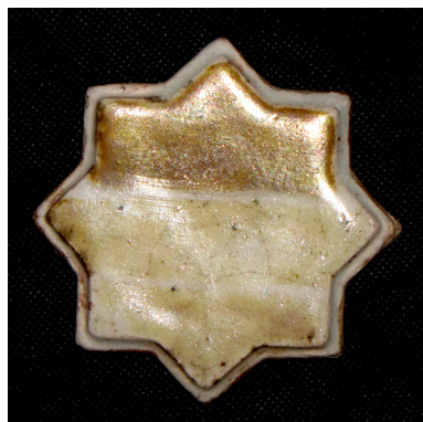
تصویر ۶- قسمت بالای تست شرایط احیاء ششم.